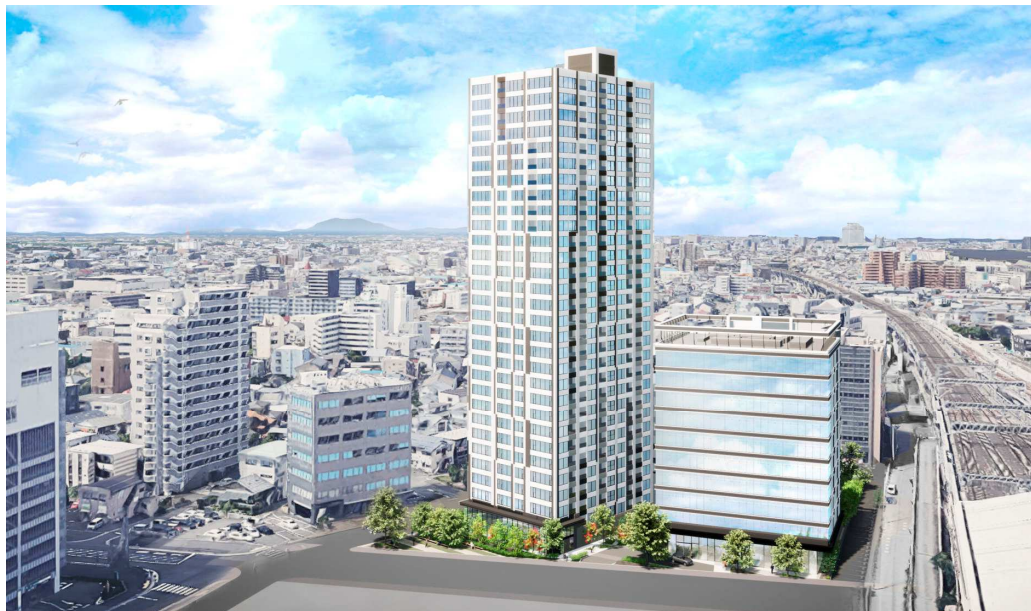
【建物外観完成予想CG】

現在、新潟市が進める新潟駅周辺整備事業とベクトルを合わせることで、新潟駅周辺の活性化はもちろん、市民県民が故郷を自慢できる、来県者には新潟の発展と住みやすさを印象づける新潟駅エリアの新たなランドマーク的存在を目指します。