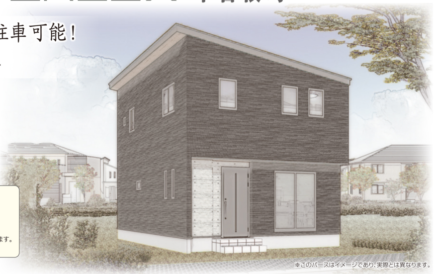
※このパースはイメージであり、実際とは異なります。

※上記返済例は借入金額2,890万円当社提携銀行年利0.90%(変動)40年返済で算出しています。 ※別途諸費用が必要です。※詳しくは営業スタッフまでお尋ねください。