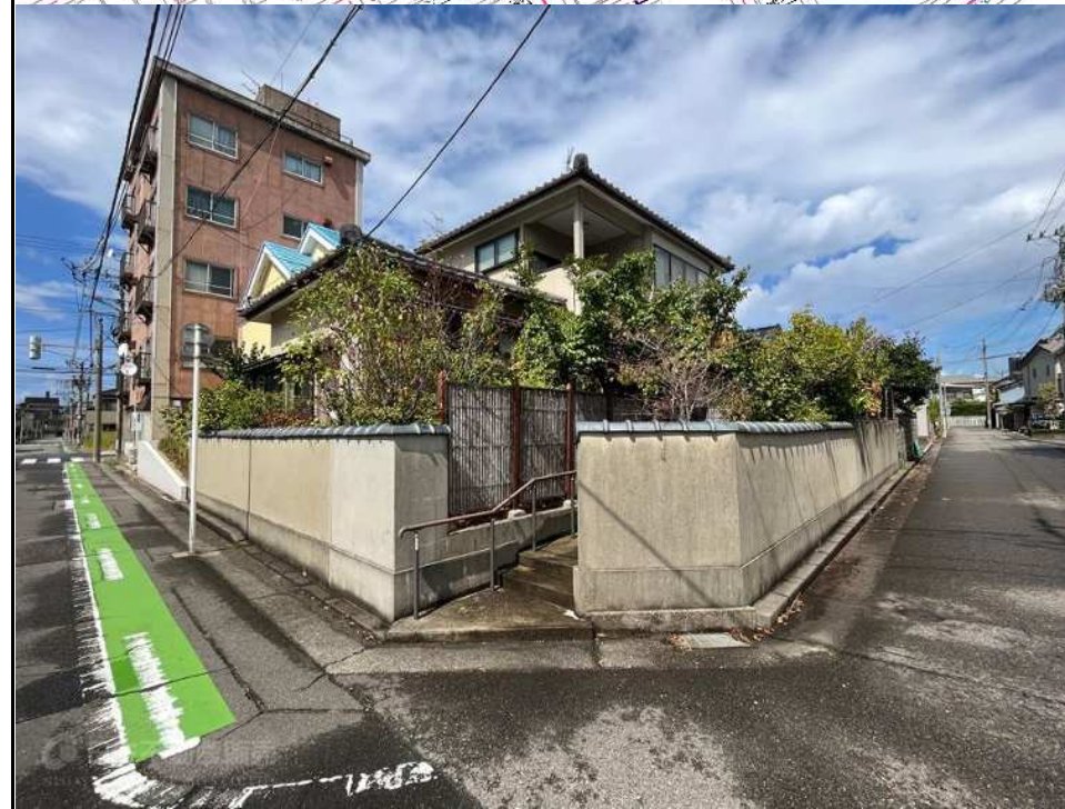
※物件資料と現況と異なる場合がありますが、その場合現況を優先致します。