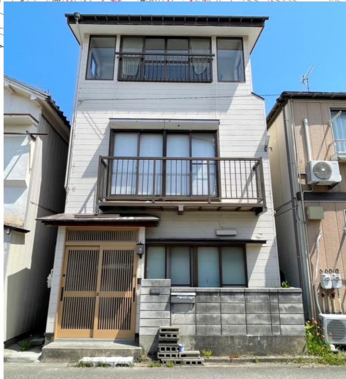
※物件資料と現況と異なる場合がありますが、その場合現況を優先致します。